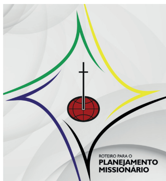
Roteiro para o Planejamento Missionário