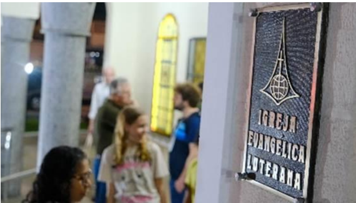
Fotos da celebração no cemitério: 04.05.2024