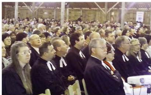
Ministros e Ministras marcaram presença na celebração do Dia Sinodal da Igreja