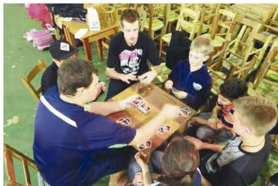
Jovens tiveram momentos de descontração entre os trabalhos realizados para o Dia Sinodal da Igreja

Após culto, eles tiveram momentos lúdicos e de integração num divertidíssimo Torneio de Sinuca, uma corrida com carrinhos de supermercado, campeonato de “UNO” e a engraçada Caçada ao Tilthapas. Foram momentos de integração e descontração entre os jovens, fortalecendo cada vez mais suas amizades e gosto de participarem de um evento tão significativo dentro do calendário eclesial-litúrgico.