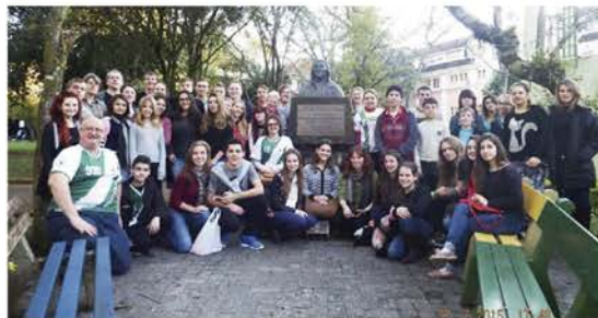
Jovens no busto de Lutero na EST