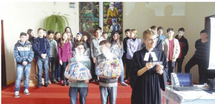
Confirmandos no dia do culto em que as cestas foram sorteadas

Com o intuito de auxiliar a OGA (Obra Gustavo Adolfo) em sua campanha anual com vistas à arrecadação de recursos necessários para viabilizar e fomentar projetos sociais em prol de crianças e adolescentes, os confirmandos da Paróquia Linha 3 Oeste em Ijuí realizaram a Ação Confirmandos 2015. A ideia foi montar duas cestas com doces diversos e sortear-las no culto do dia 28 de junho. Cada confirmando trouxe de casa algo para compor as cestas e, da mesma forma, cada um se empenhou na venda de números a quem quisesse concorrê-las. O resultado do esforço foi a arrecadação de R$ 760,00, valor que será repassado para a OGA. Embora o valor não seja tão alto, a comunidade sente-se feliz por fazer sua parte na construção de um mundo melhor e, também, por acreditar nos adolescentes os protagonistas de ações em benefício social.