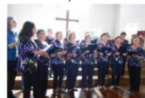
Linha Três Oeste