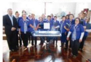
Quinze de Novembro