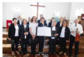
Linha Três Oeste